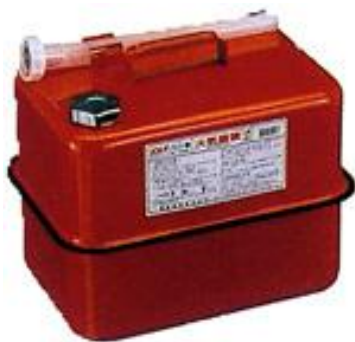
ガソリンの貯蔵に適した容器の例 (金属製容器であることが必要)