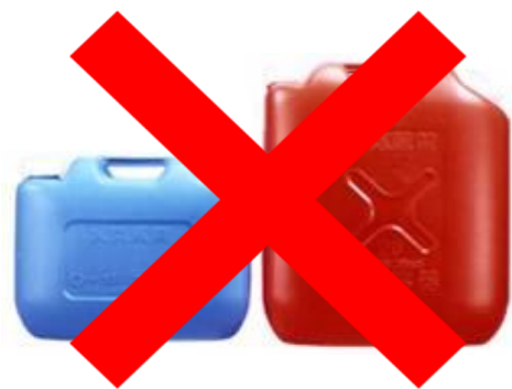
ガソリンの貯蔵に適さない容器の例 (樹脂製容器は火災危険性が高い)